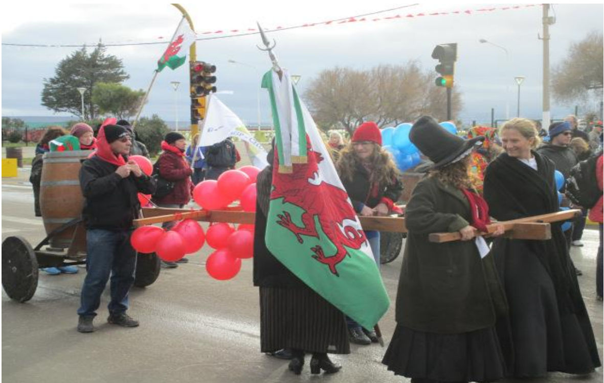
Figura V. Largada de la Carrera del Barril, desde el Monumento a los Colonos Galeses hacia Punta Cuevas.