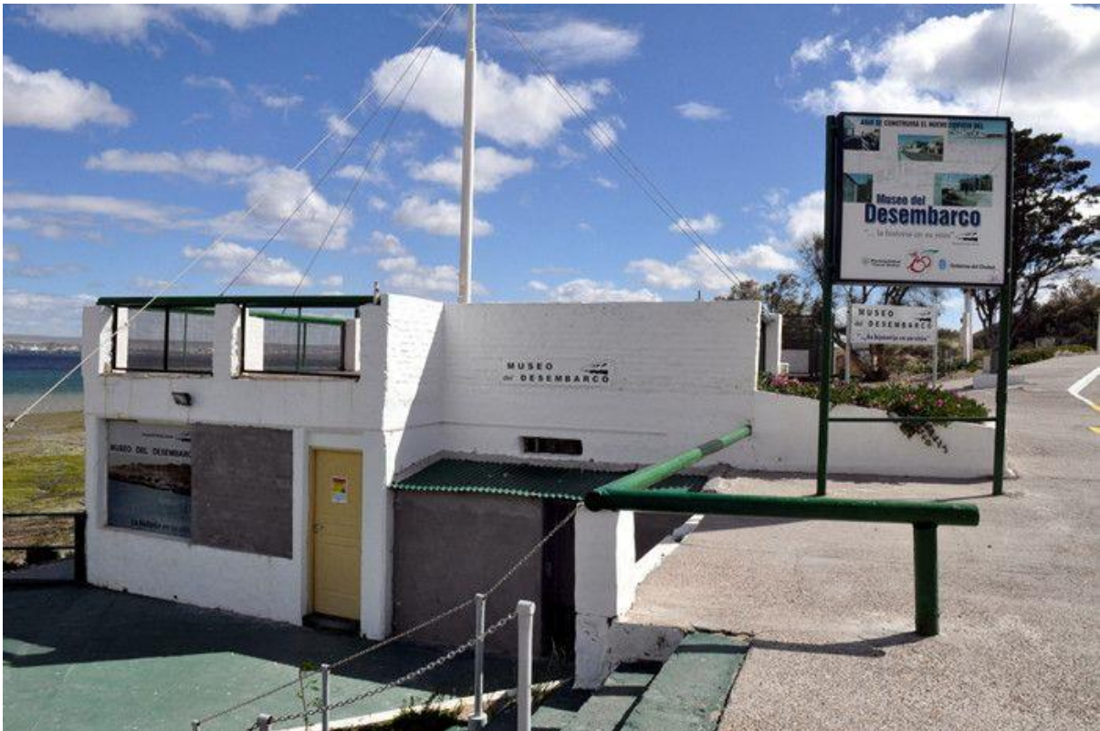
Figura VIII. Actual edificio del Museo del Desembarco.