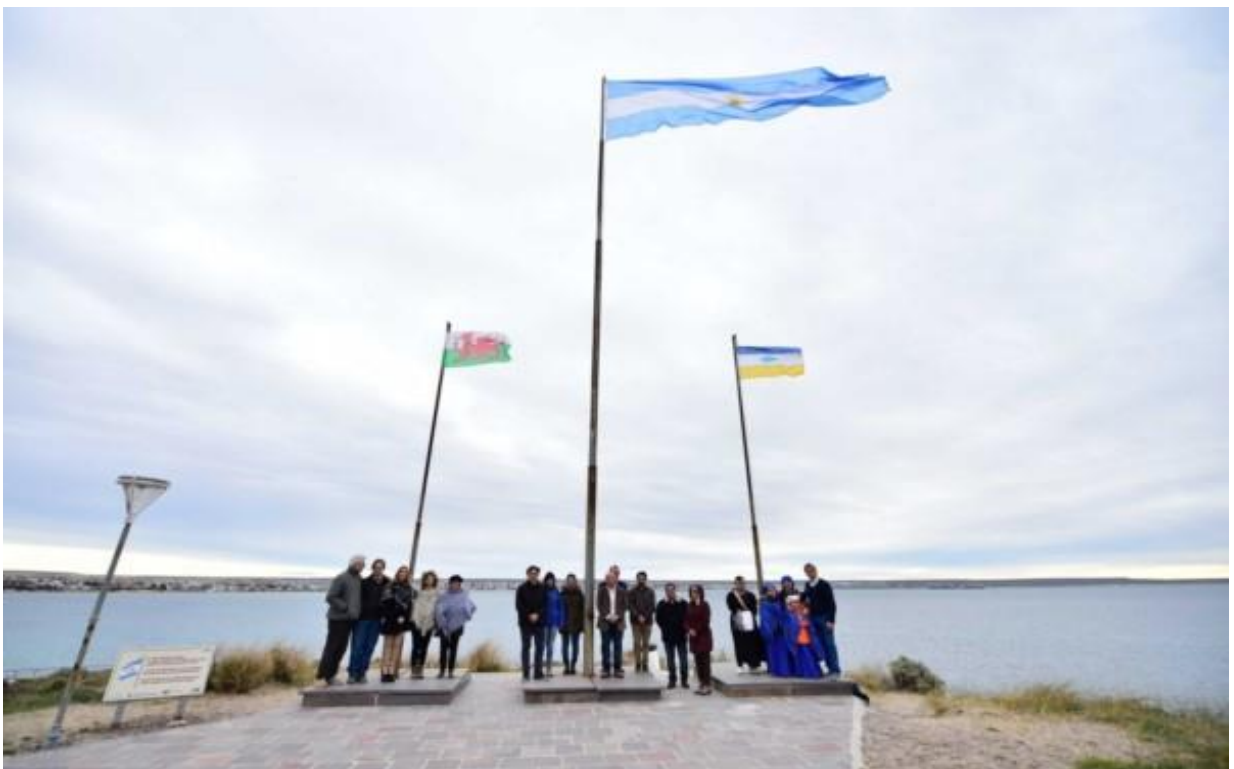
Figura III. Izamiento de las banderas en el tope de Punta Cuevas. (Unos 30 m.s.n.m)