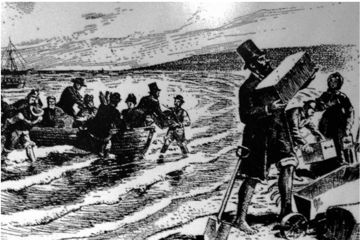
Figura IX. Ilustración del momento del desembarco, el 28 de Julio de 1865, en Punta Cuevas.