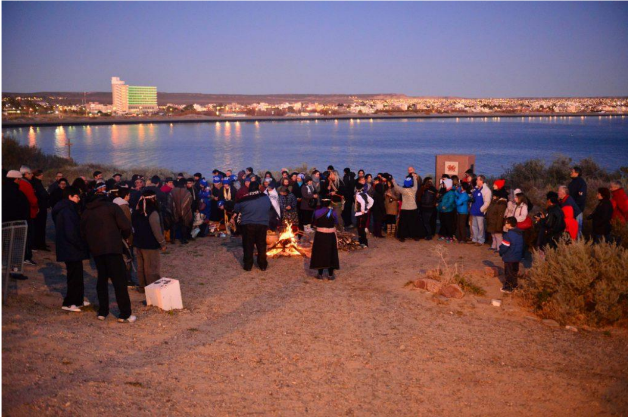
Figura II. Rogativa Mapuche-Tehuelche, realizada en Punta Cuevas. (8 a.m.)