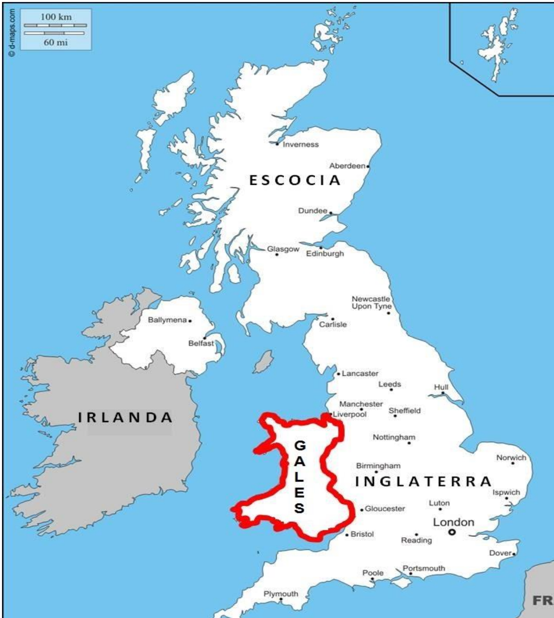
Figura XI. Ubicación geográfica del País de Gales.