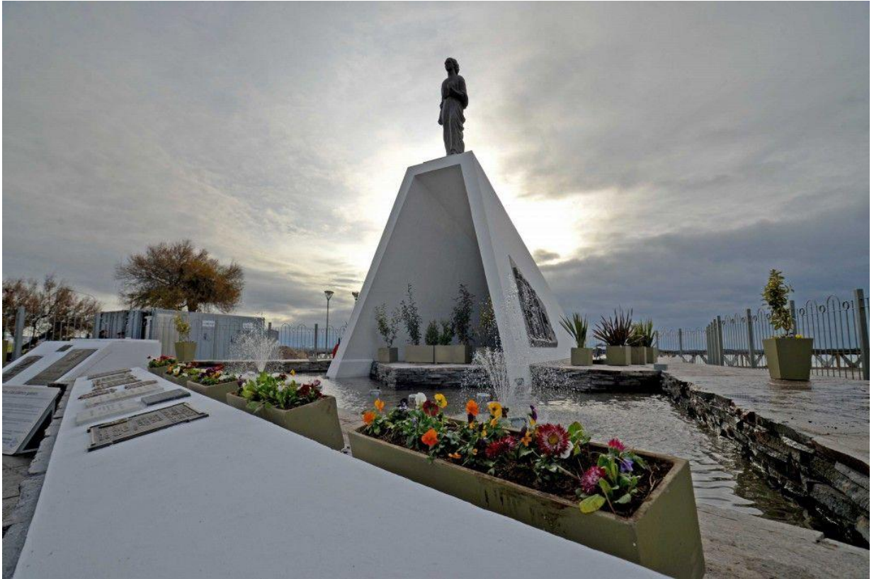
Figura IV. Ofrenda floral en el Monumento a los Colonos Galeses, inaugurado el 28 de Julio de 1965.