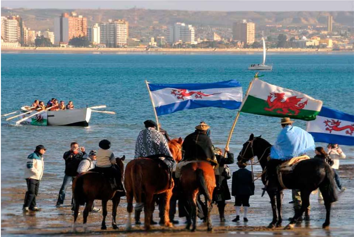
Figura VI. Recreación del Desembarco en la playa de Punta Cuevas, Puerto Madryn.