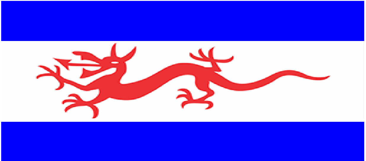
Figura I. Bandera izada durante la zarpada hacia Patagonia, el 25 de Mayo de 1865.