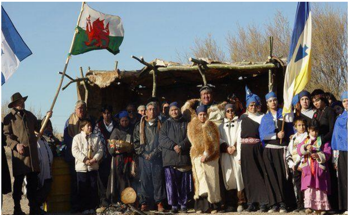
Figura VII. Encuentro de Dos Culturas en Punta Cuevas.