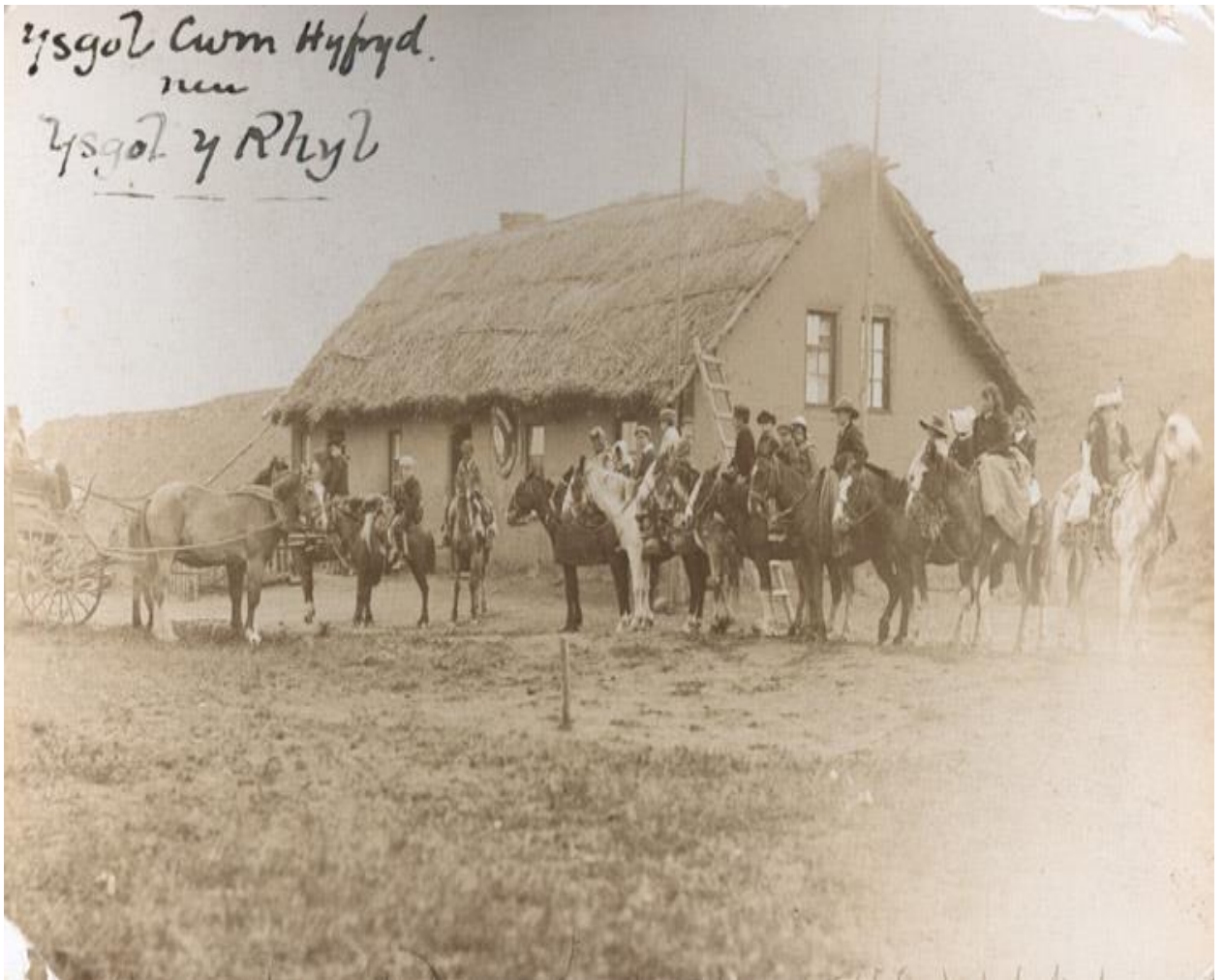
Figura X. Arquitectura típica galesa, en el valle del Río Chubut.